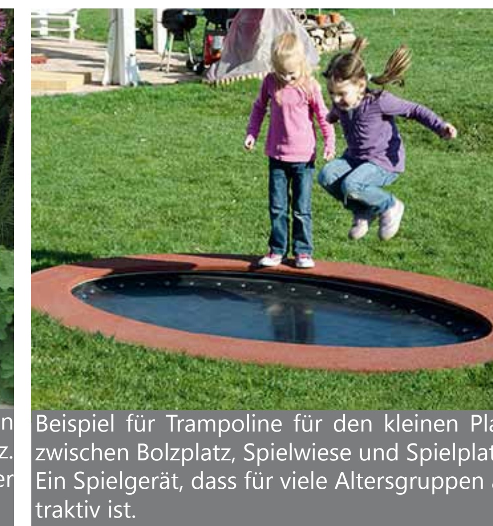
Beispiel für Trampoline für den kleinen Platz zwischen Bolzplatz, Spielwiese und Spielplatz. Ein Spielgerät, dass für viele Altersgruppen attraktiv ist.