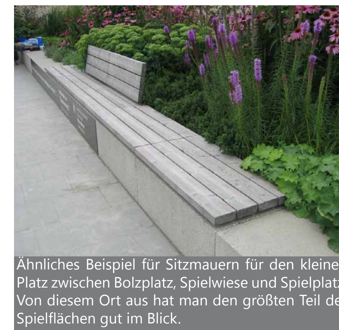
Ähnliches Beispiel für Sitzmauern für den kleinen Platz zwischen Bolzplatz, Spielwiese und Spielplatz. Von diesem Ort aus hat man den größten Teil der Spielflächen gut im Blick.