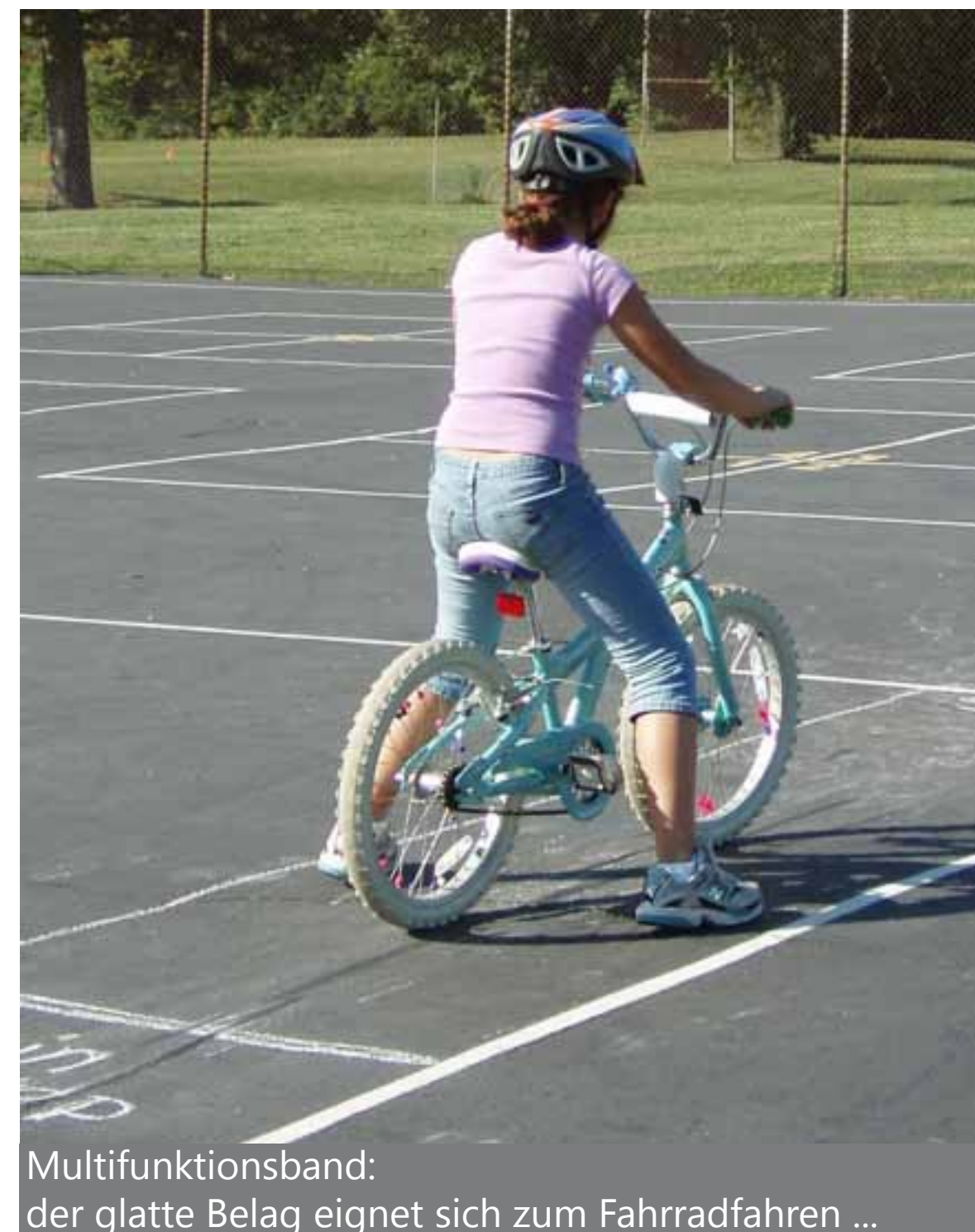
Multifunktionsband: der glatte Belag eignet sich zum Fahrradfahren ...