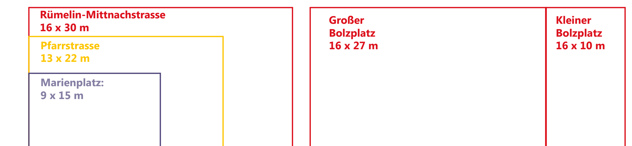
Größenvergleich Bolzplätze Stuttgart

Der bestehende Bolzplatz wird in seiner Größe an in Stuttgart übliche Größen für Bolzplätze angepasst. Dadurch wird eine Teilung in einen großen und einen kleinen Bolzplatz möglich, so dass mehrere Gruppen gleichzeitig spielen können.