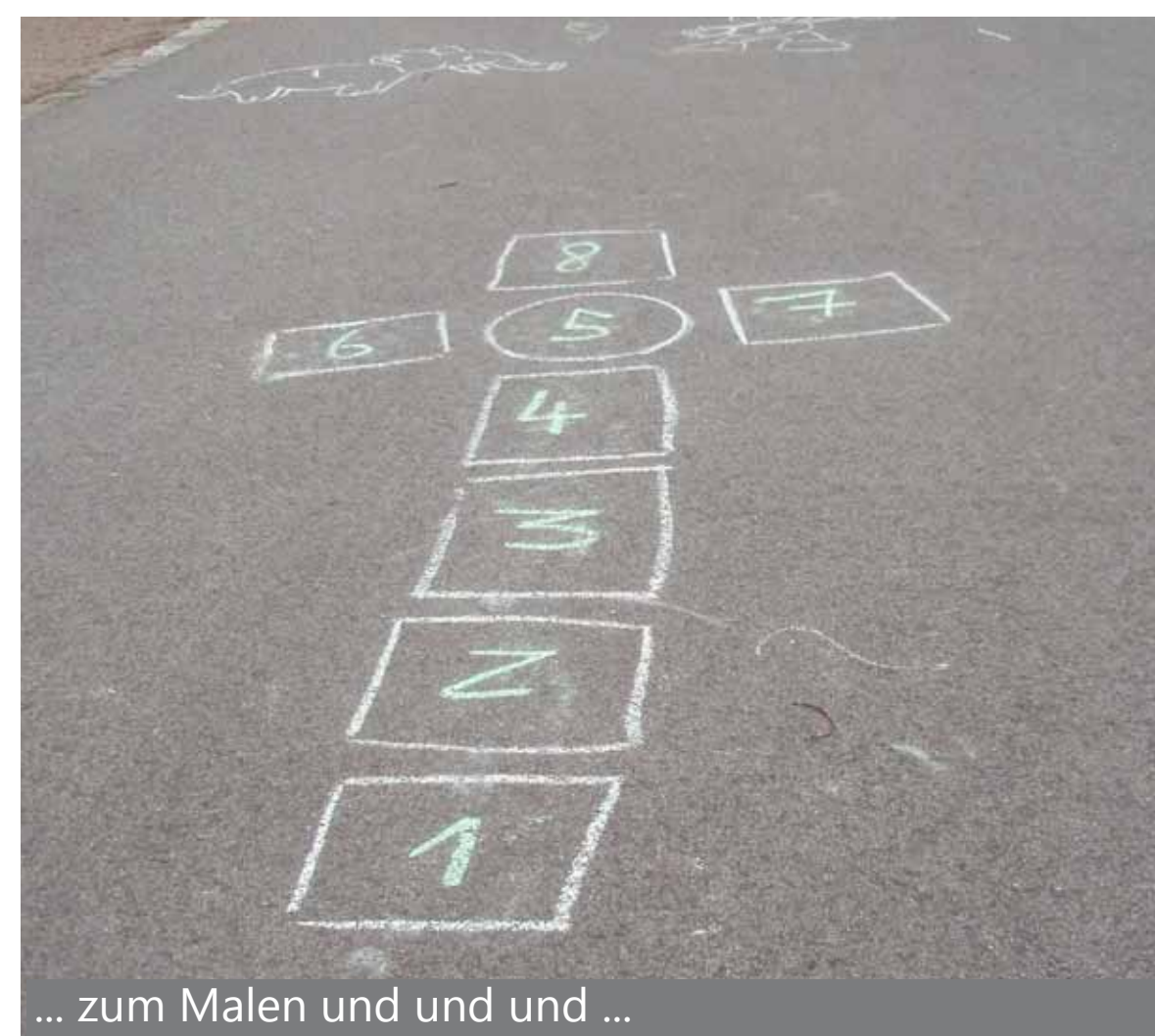
... zum Malen und und und ...