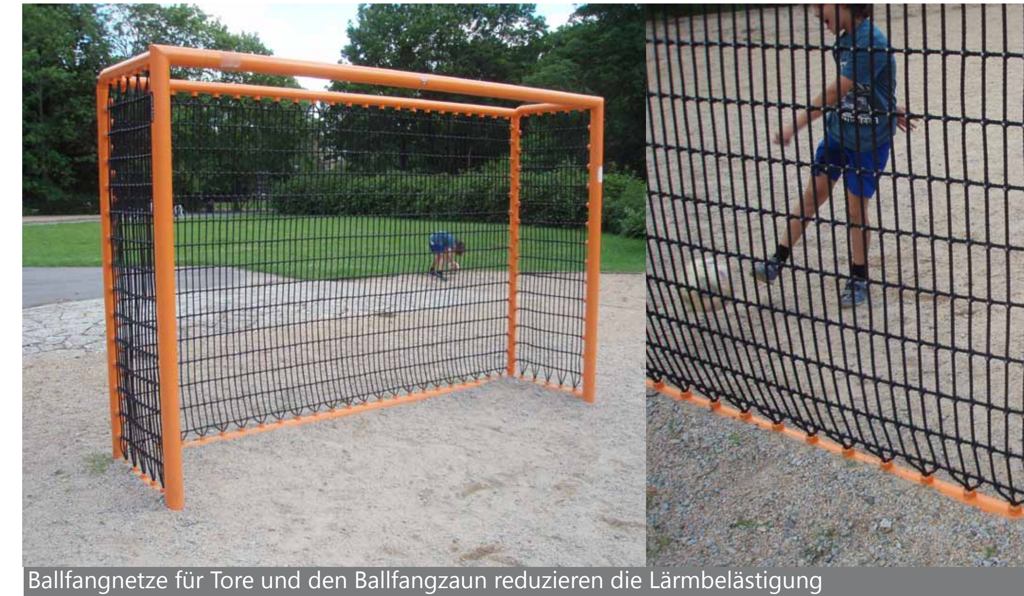
Ballfangnetze für Tore und den Ballfangzaun reduzieren die Lärmbelastung