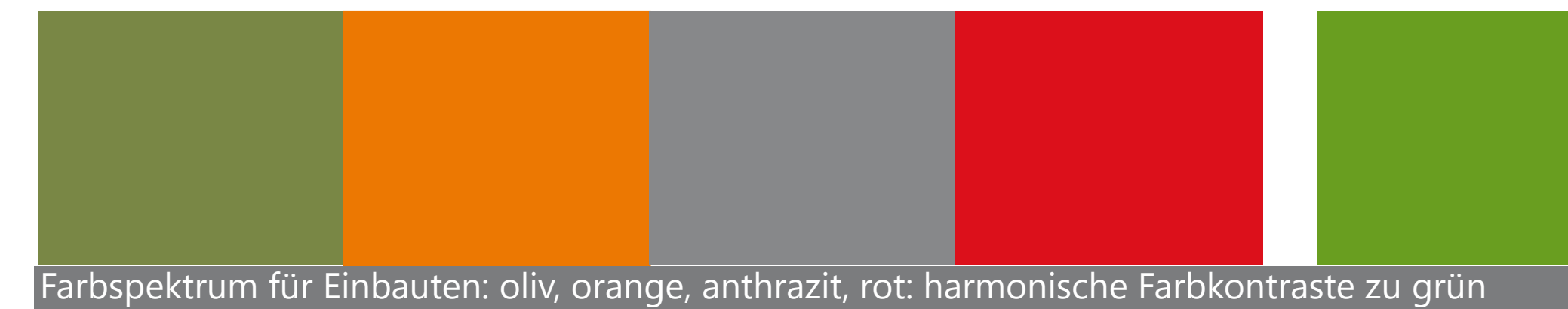
Farbspektrum für Einbauten: oliv, orange, anthrazit, rot: harmonische Farbkontraste zu grün