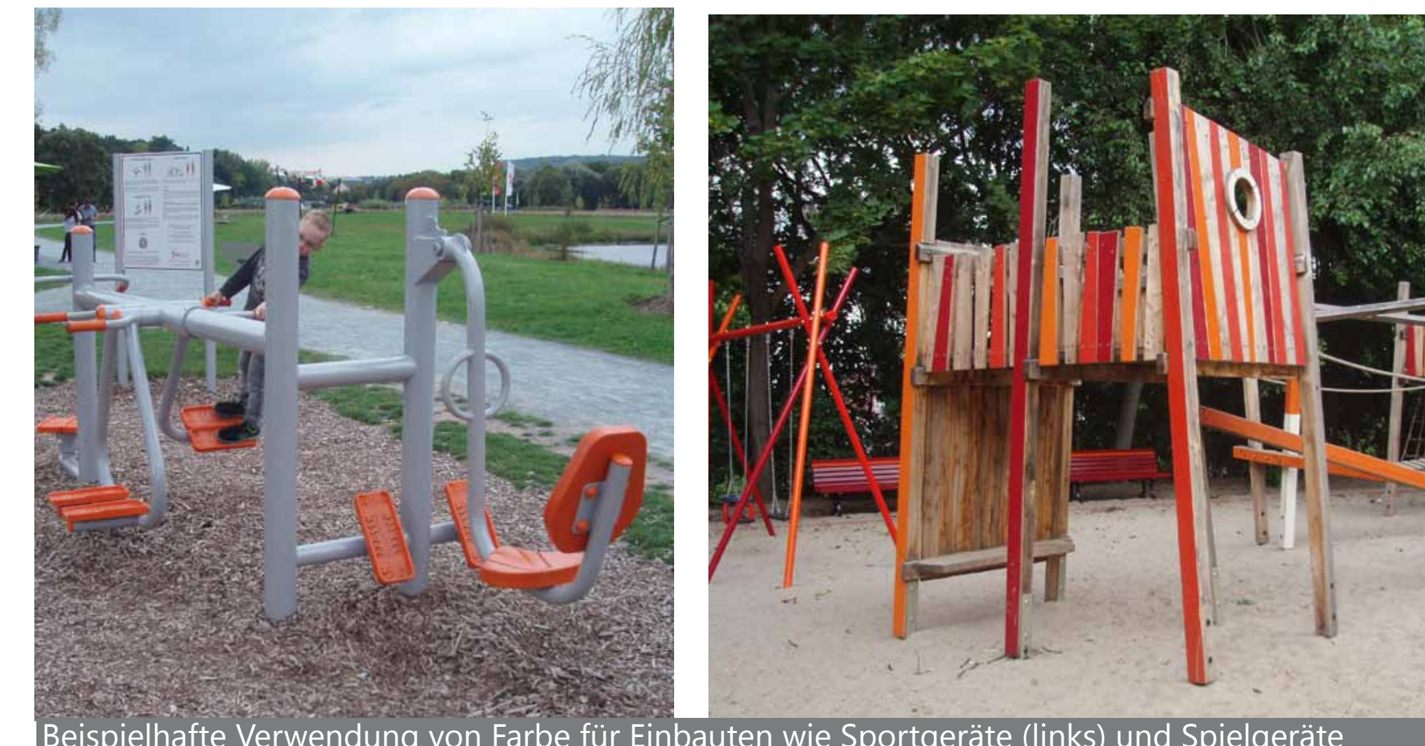
Beispielhafte Verwendung von Farbe für Einbauten wie Sportgeräte (links) und Spielgeräte